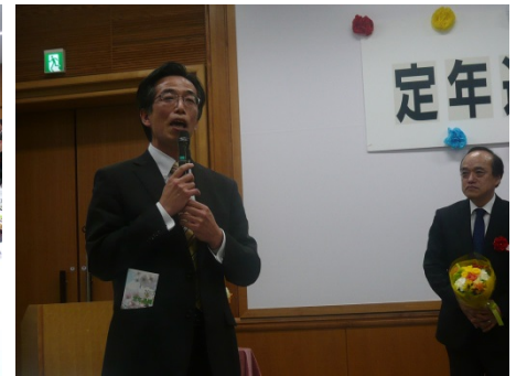
▲事業連合)和久井専務理事から一本ジメ