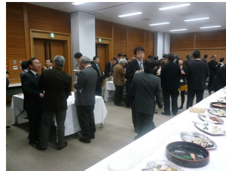
▲多くの皆さまのご参加がありました