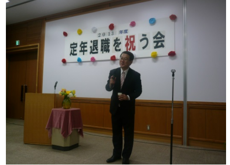
▲連合会) 毎田常務理事から乾杯のご発声