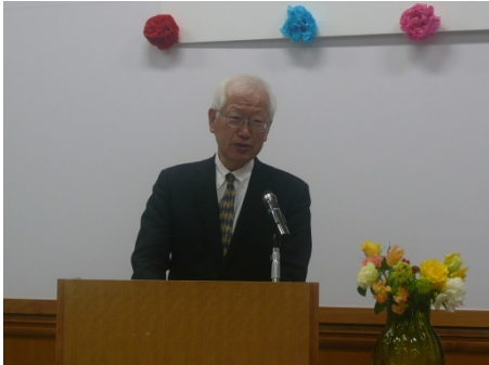
▲事業連合) 椿理事長からご挨拶

「定年まで働くことができると思わなかったが、皆さんに本当に感謝したい」「いろいろあった生協人生ですが振り返ってみれば長いようで短かった気がします」…2014年3月27日(木)に定年退職の方31名中18名が出席し、約140名の方々に囲まれた「祝う会」となりました。お忙しい中参加された皆さま、誠にありがとうございました。あいにく参加できなかった皆さまも含めて、当日の「祝う会」の様子をご報告します。